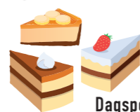
Dagspecials: Vraag de bediening 4,35